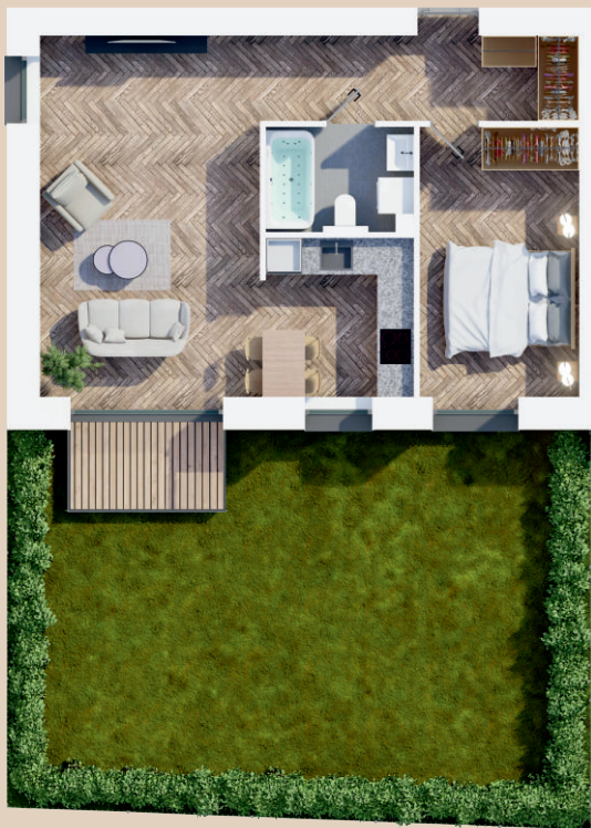
A103: 51,39 m 2 1 aukštas, 2 kambariai terasa 4 m 2 kiemas 0,61 a

Pirmajame A korpuso aukšte: administracinės patalpos; vienas dviejų kambarių butas.