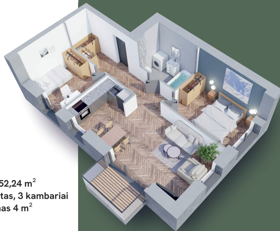
B205: 52,24 m 2 2 aukštas, 3 kambariai balkonas 4 m 2