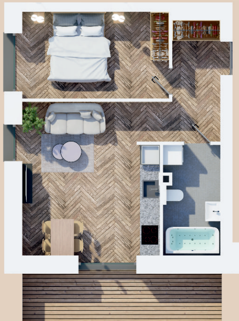
Butas C402: 42,77 m 2 4 aukštas, 2 kambariai, balkonas 10,8 m 2

Statybų pabaiga: 2024 m. II-III ketvirtis