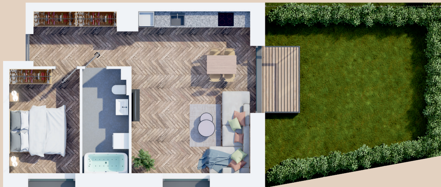
Butas C103: 50,45 m 2 1 aukštas, 2 kambariai, terasa – 4 m 2 , kiemas 41 a